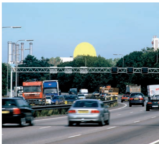
Olafur Eliassons (f. 1967) koncept for omgivelserne, Surroundings Surrounded (2000). På modstående side ses hans The Weather Project (2003)

klimaforskning har krævet endnu mere avancerede modeller, der integrerer viden mange steder fra. Den tyske tværvidevidenskabelige forsker Alfred Wegeners (1880-1930) banebrydende teori om Jordens tektoniske plader var jo også blevet til via en kombination af viden fra palæontologien, zoologien, geofysikken og geologien. Man var ganske simpelt meget tidligt blevet klar over, at for at opnå banebrydende resultater, skulle der mere til end en klassisk geografuddan-